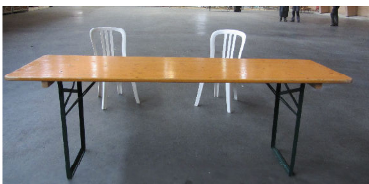
Festtisch mit 2 Kunststoff-Stühlen (allfällige Tischabdeckungen erfolgen durch die Aussteller)